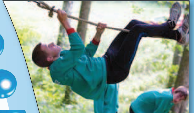
Poprvé máme Mistry republiky v závodech požárnícké všestrannosti dva – Měnik a Majetín.