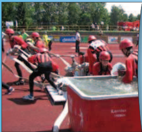
Královská disciplína patřila Pískové Lhotě, které se povedl útok za neuvěřitelných 18,5 s