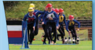
Parta z Měnika brzy všechny přesvědčila, že to myslí s obhajobou mistrovského titulu vážně.