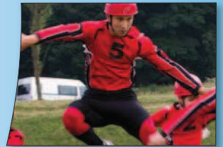
Ve štafetu CTIF se za suverénním Měnikem umístily na druhém místě Uhlířské Janovice.