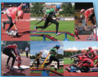
Malí hasiči na mistrovství republiky v Sokolově předvádějí vynikající výkony.